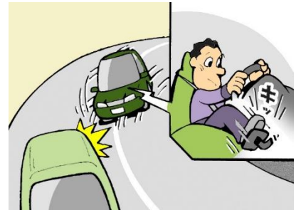
カーブでのスピード出しすぎ