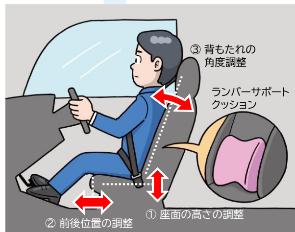
図2. シート調整の一例