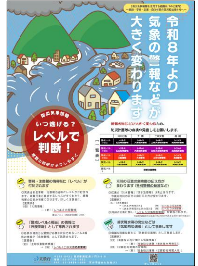
気象庁「新たな防災気象情報について（令和8年～）」